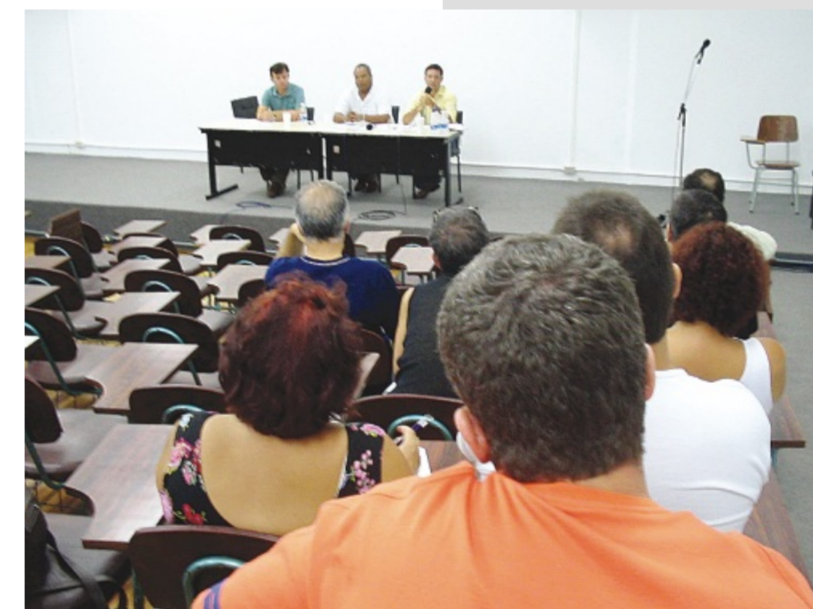
Escolha de delegados para 25º Congresso ficou para fevereiro