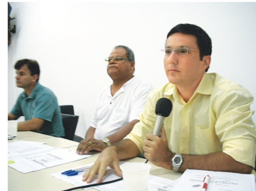
Advogado expôs o andamento de ações que envolvem os docentes