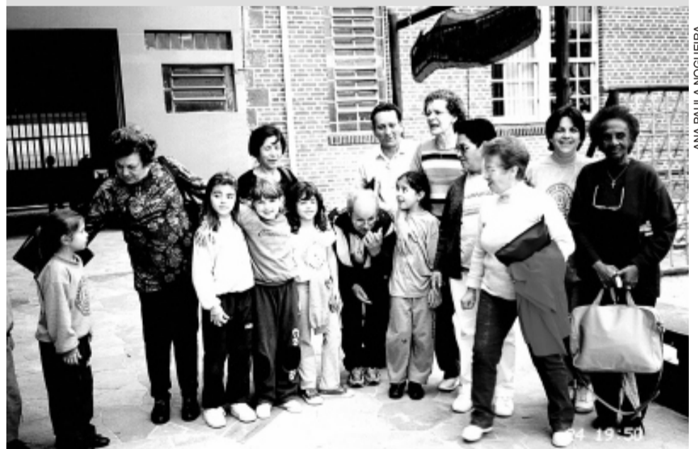
Convívio entre adultos e crianças faz parte do projeto

Neste mês, a Escola para Adultos completa 10 anos de funcionamento. As atividades festivas do mês de agosto incluem um culto em ação de graças com a participação do coral e um jantar de confraternização no dia 10 de agosto. Mas, as comemorações se estendem até o final do ano. Em setembro haverá um encontro de corais, em outubro uma viagem e, em novembro, um jantar de encerramento do ano letivo.